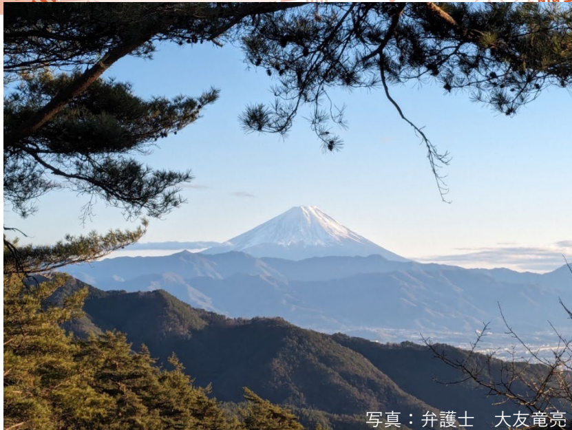
写真：弁護士 大友 竜亮

新年あけましておめでとうございます 本年もよろしくお願ひ申し上げます よつば総合法律事務所 一同