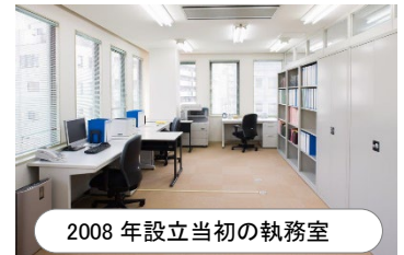
2008 年設立当初の執務室

■ 2008 年 10 月 16 日 法人化して弁護士法人よつば総合法律事務所となる。