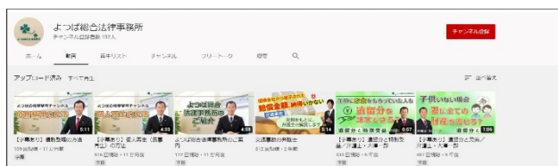
よつばの YouTube のホームはこのような画面です

みなさま、よつば総合法律事務所の YouTube チャンネルをご存じでしょうか？実は7年も前からチャンネルを開設して法律に関する動画を配信しています。(もし「初めて知った！」という方は YouTube 内で「よつば総合法律事務所」と検索してみてください！ぜひチャンネル登録もお願いいたします！)