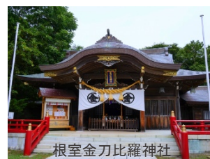
根室金刀比羅神社

是非とも皆様にお勧めなのが、毎年8月9～11日に行われる「根室金刀比羅神社例大祭」です。北海道三大祭りの一つに数えられるほどの大きなお祭りで、令和2年に「北海道無形民俗文化財」に指定されました。