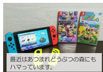
最近はおつまれどうぶつの森にもハマっています。

8というだけあって、今のゲームは何とも奥が深いです…。キャラクターやマシンパーツ(車体、タイヤ、カイト)を組み合わせ、自分好みのマシンで走行できるのですが、各パーツに特性があり、マシン選びに凝ってしまうとなかなかスタートできなくなってしまうので要注意です。ちょっとした息抜きになれば、という気持ちで買ってみたものの子供相手について熱くなってしまう、対戦中は瞬きするのを忘れてしまいそうになります。大人げなく常に本気なので、勝ったときの爽快感は何とも言えないものです(笑)家族の絆も深まり(?)、楽しいひとときを過ごせたので買ってよかったです。