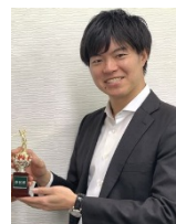
トロフィーの贈呈