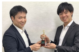
3位の渡邊よりトロフィーの贈呈

【お問合せ】よつば総合法律事務所 ☎0120-916-746(フリーダイヤル) ✉info@yotsubasougou.com 🌐https://yotsubalegal.com/