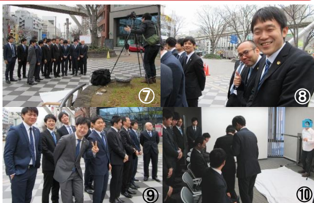
⑦カメラマンさんの指示で立ち位置を微調整しています ⑧寒そうながらも笑顔で頑張っています！ ⑨今回はたくさん撮影したので合間でオフショットブレイク ⑩座り・立ち位置を入念に決めております ⑪(ページ上)外で撮った渾身の1枚です！