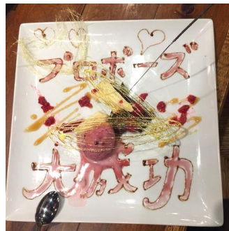
某弁護士はプロポーズをここで…？！