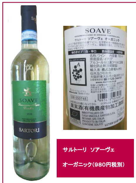
サルトーリ ソアーヴェ オーガニック(980円税別)