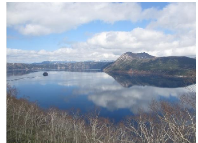
私の好きな場所：摩周湖