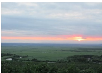
釧路といえば：釧路湿原

釧路は「冬とにかく寒い!!」という点を除けば、とてもとてもよい場所で、今では第2の故郷と感じるほどです。大自然、美味しい海の幸、綺麗な夕焼けが魅力の釧路、ぜひみなさんも旅行してみてください！