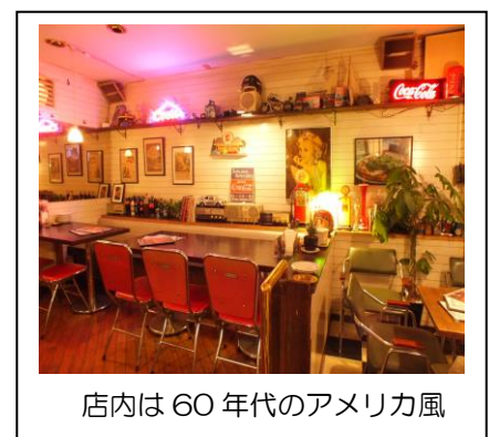
店内は60年代のアメリカ風

28年間千葉にあるアメリカンピザ専門店です。店内では「バック・トゥ・ザ・フューチャー」等の米国映画や音楽が流れ、どこか懐かしくポップな雰囲気です。時間帯限定でピザの食べ放題も出来、お取り寄せ品の「冬眠ピザ」が雑誌でも紹介される人気店です。