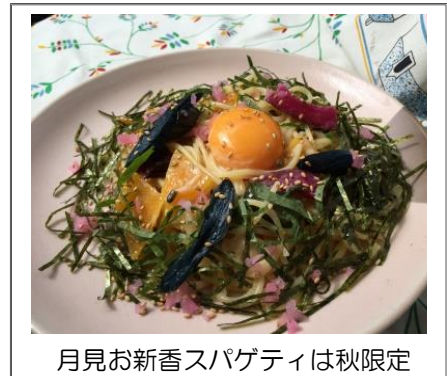
月見お新香スパゲティは秋限定

千葉公園方面に10年以上前からある和風カフェです。彩り豊かな季節の創作パスタが有名で、味噌風味やお新香のパスタがお勧めです。もちろん、ケーキも和洋様々な種類があり、美味しいです。ランチタイム(月～土、11～15時)は、ドリンクにケーキまで付いて1,200円前後とお得です。但し、女性客が多いので、男性の方は女性の方と一緒に来店されることをお勧めいたします。