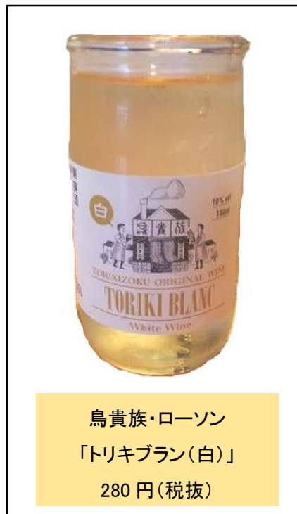
鳥貴族・ローソン 「トリキブラン(白)」 280円(税抜)